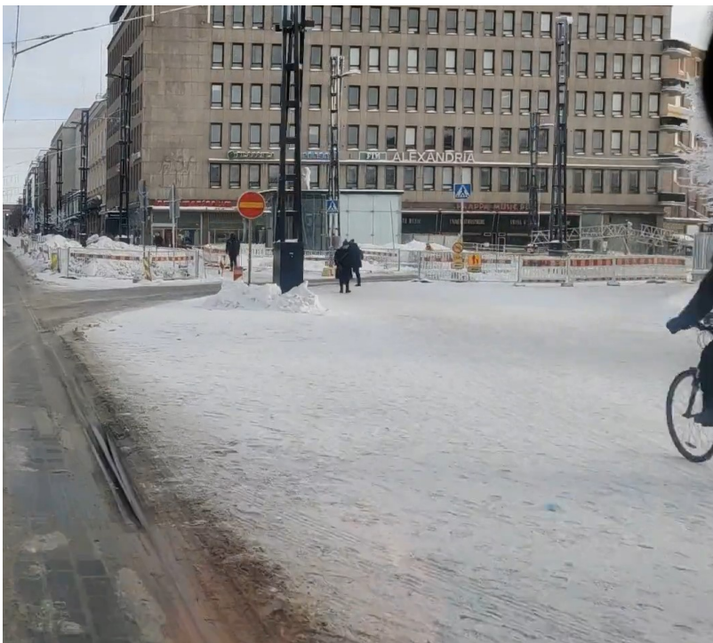
Kuvakaappaus 9.2.2021 klo 12:44, lumipolanne