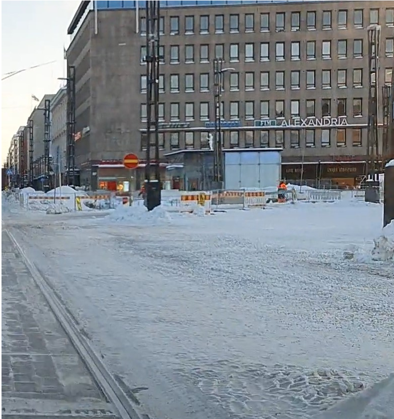
Kuvakaappaus 5.2.2021 klo 09:25, hiekoitus ja lumipolanne